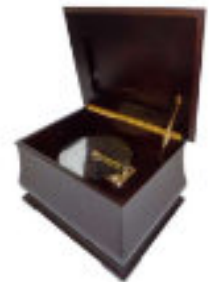
フジゲン 45弁ディスクオルゴール