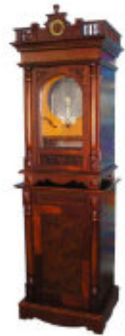
フジゲン 45弁ディスクオルゴール