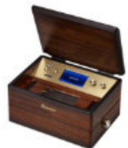
“1台300曲以上生演奏” プリモトーン ブラウンモデル