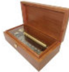
フジゲン 72弁シリンダーオルゴール

オルゴールの音色には、人間の耳では聞き取れない非常に高い周波数（10万Hz以上）から低い周波数まで広い帯域の音が含まれており、これを繰り返し聴くことで人本来の持つ回復力を高め、自然のままの健康体に戻る働きを助けると言われています。