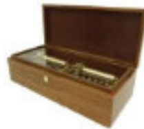
フジゲン 100弁シリンダーオルゴール