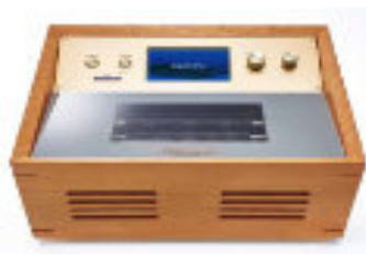
“1台150曲以上生演奏” プリモトーン ナチュラルモデル