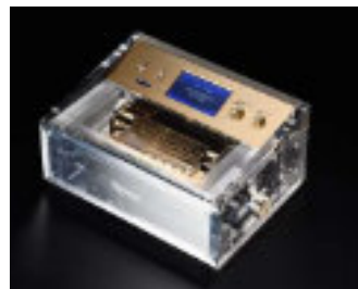
“1台1100曲以上生演奏” プリモトーン クリスタルモデル