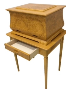
FCO-T-05 120,000円 (税込132,000円) 幅63.0cm × 奥行49.0cm × 高さ67.4cm