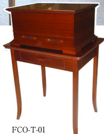
FCO-T-01 100,800円 (税込110,880円) 幅62.5cm × 奥行49.0cm × 高さ67.5cm