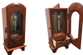
[FSO-MMB] スタンダードA(南京錠) 140,000円(税込154,000円)スタンダードB(カマ錠) 145,000円(税込159,500円)