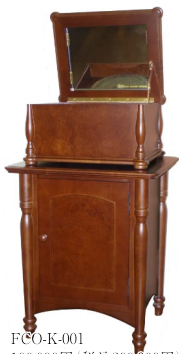
FCO-K-001 190,000円 (税込209,000円) 幅56.0cm × 奥行50.0cm × 高さ67.0cm