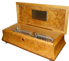
【FSO-3200T】 630,000円 (税込693,000円)