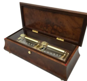
【FSO-3300K】 640,000円 (税込704,000円)