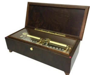
【FSO-3000WNT】 620,000円 (税込682,000円)