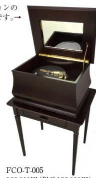
FCO-T-005 120,000円 (税込132,000円) 幅62.5cm × 奥行49.0cm × 高さ67.5cm