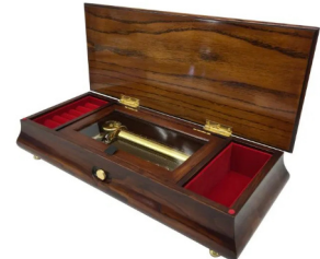
【FSO-85J】 180,000円 (税込198,000円)