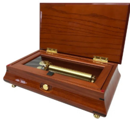
【FSO-750】 165,000円 (税込181,500円)