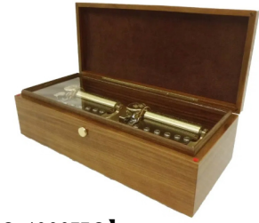
【FSO-4000HO】 700,000円 (税込770,000円)