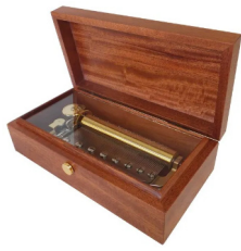
【FSO-500M】 150,000円 (税込165,000円)