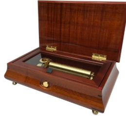
【FSO-800K】 180,000円 (税込198,000円)