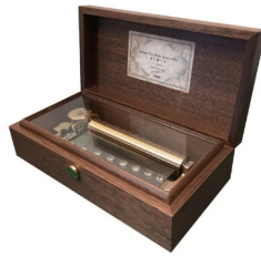
【FSO-500WNT】 160,000円 (税込176,000円)