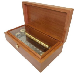
【FSO-500C】 150,000円 (税込165,000円)