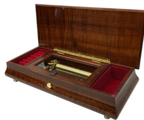
【FSO-1200K】 210,000円 (税込231,000円)