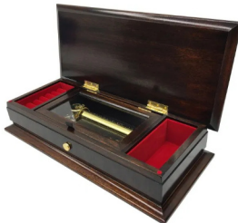
【FSO-100J】 190,000円 (税込209,000円)